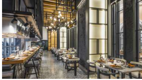
ASIANA A'LA CARTE RESTORAN