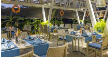
POSEIDON A'LA CARTE RESTORAN