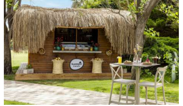
KUMPIR CORNER (Kumpir Çeşitleri)