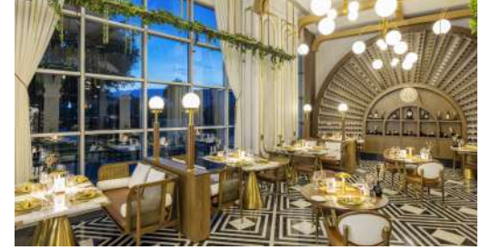
DAVINCI A'LA CARTE RESTORAN