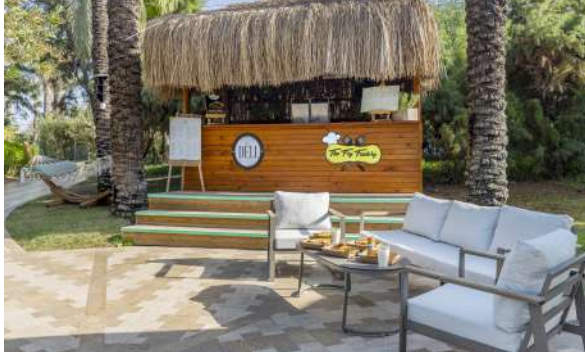
THE DELI TOAST (Tost Çeşitleri)