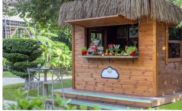
FIT & WELLNESS (Sağlıklı Atıştırmalıklar)