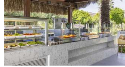
NEYZEN CAFE & RESTORAN

Gözleme Çeşitleri, Çi Börek, Meyve ve Dondurma