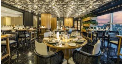
VINARIO STEAK HOUSE (7 yaş altı çocuk alınmamaktadır.)