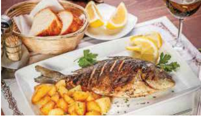
POSEIDON A'LA CARTE RESTORAN