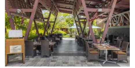
DAFNE A'LA CARTE RESTORAN

Gözleme Çeşitleri, Çi Börek, Meyve ve Dondurma