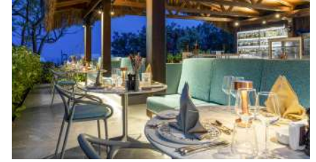
NEYZEN CAFE & RESTORAN