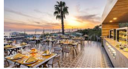
BBQ A'LA CARTE RESTORAN