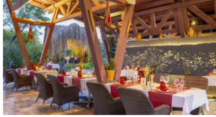
DAFNE A'LA CARTE RESTORAN